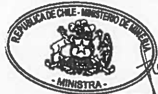
AURORA WILLIAMS BAUSSA MINISTRA DE MINERÍA